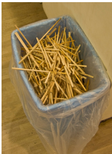
Mülleimer in einer Mensa in Japan

Früher hat man Ess-Stäbchen aus Bambus hergestellt, einer Pflanze, die sehr schnell nachwächst. Heute wird aber meistens einfaches Holz oder auch Plastik zu Herstellung von Ess-Stäbchen verwendet.