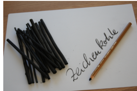
Zeichenkohle © Beate Kohler

Zeichenkohle entsteht beim Verbrennen von verschiedenen Holzarten. Heute wird hierzu insbesondere Weidenholz genutzt, aber auch Linde, Obstbäume oder Birke eignen sich hierfür, d.h. alles Baumarten, die auch bei uns in Deutschland und in Mitteleuropa wachsen. Mit verkohltem Holz haben schon unsere Vorfahren vor Urzeiten gezeichnet, wie man an vielen Höhlenzeichnungen sehen kann.