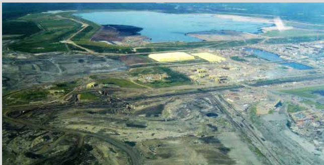
Athabasca Ölsandrevier, Alberta

Um das Erdöl aus dem Öl-Sandgemisch zu trennen, sind aufwendige Produktionsschritte mit hohem Energiebedarf notwendig. Dabei entsteht drei bis fünf Mal so viel CO 2 wie bei der herkömmlichen Gewinnung von flüssigem Erdöl. Ein Drittel der Energie, die das Öl liefert, wird bereits bei der Herstellung verbraucht. Ölsandabbau trägt damit zum Klimawandel bei. In Tailing Ponds (Abwasserseen) werden die zurückbleibenden giftigen Flüssigkeiten gelagert. Giftige Stoffe gelangen dennoch in Flüsse und Grundwasser. Vor allem die Ureinwohner, die vom Fischfang und der Jagd leben, sind von den ökologischen Folgen betroffen.