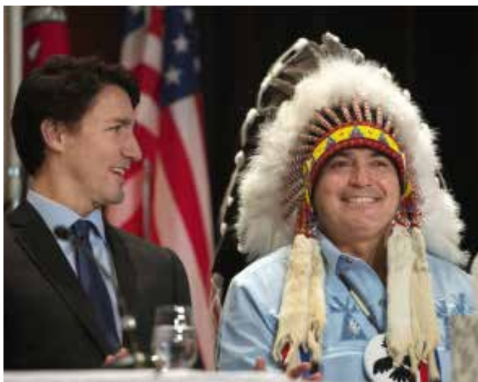
Premierminister Justin Trudeau und National chief der First Nations, Perry Bellegarde

Vielfalt und Aufgeschlossenheit schätzen die KanadierInnen sehr und fördern sie in Politik und Gesellschaft. Englisch und Französisch sind die offiziellen Amtssprachen. Die französischsprachigen Einwohner, 21 Prozent, leben in der östlichen Provinz Quebec, einer der 13 Provinzen bzw. Territorien. Dort herrscht ein starkes regionales Verbundenheitsgefühl, das das Motto „Je me souviens“ (ich erinnere mich) sehr gut umschreibt. Es bedeutet so viel wie, dass dort bewusst Traditionen gepflegt und die Erinnerungen an ihre französische Herkunft lebendig gehalten werden.