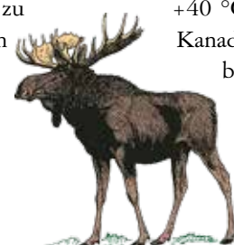
Elch ( Alces alces )

im Norden hingegen gehört zu den ältesten geologischen Formationen der Welt. Dort findet man Gesteine, die mehrere Milliarden Jahre alt sind. Die „Großen Seen“ im Süd-Osten wurden während der letzten Kaltzeit gebildet. Bekannt sind die Niagara-Fälle an der Grenze zu den USA, deren Wassermassen vom Erie- in den Ontariosee 57m in die Tiefe stürzen und über den Sankt Lorenz