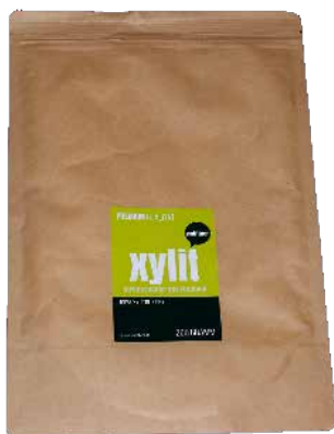
Birkenzucker (Xylit wird heute oft in der Zahnpflege oder Zuckerersatz genutzt.)

dungsrechte in Bezug auf die Ressource Wald. Durch gezielte Bildungsmaßnahmen und Zusammenarbeit werden vor allem durch das traditionelle Wissen der Ureinwohner im Umgang mit der Natur neue Vermarktungsmöglichkeiten für Nicht-Holz-Produkte aus dem Wald erschlossen. So entstehen einerseits wirtschafts- und gesellschaftliche Entwicklung und andererseits werden die Kultur, Spiritualität und biologische Vielfalt der Ökosysteme erhalten.