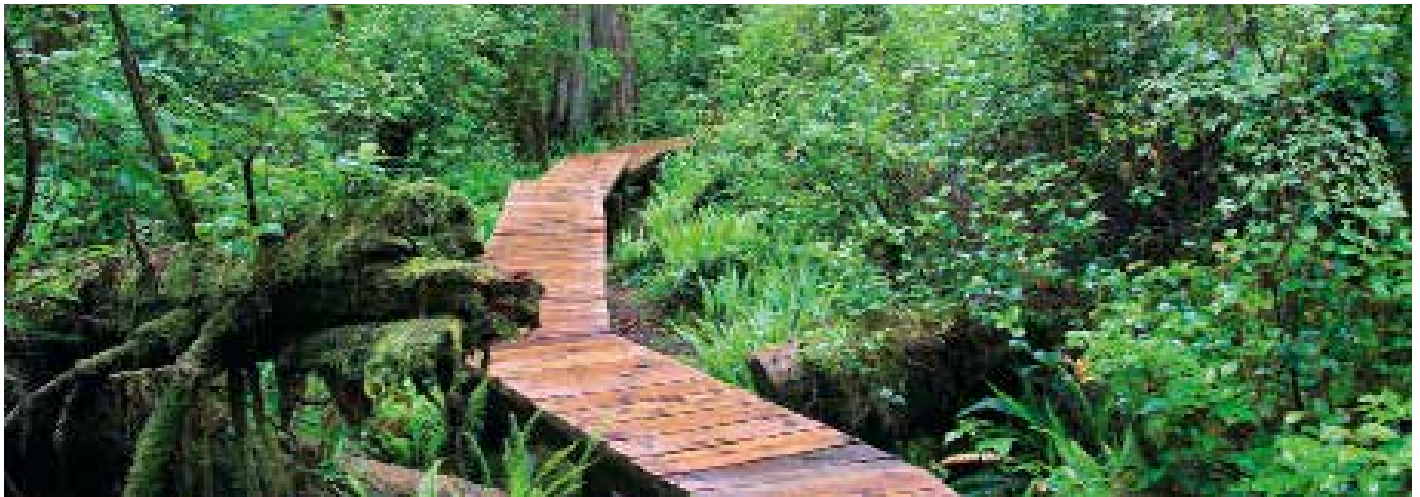
Regenwald der Westküste, Vancouver Island

D er Wald gehört zur nationalen Identität der kanadischen Bevölkerung. Er ist wichtig in wirtschaftlicher, ökologischer, kultureller und spiritueller Hinsicht. Rund 347 Millionen Hektar Wald bedecken die Fläche des Landes. Das