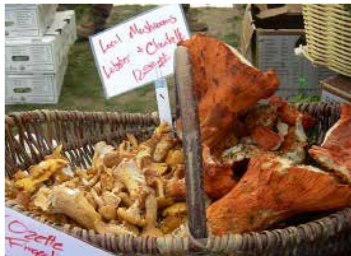
Pfifferlinge aus Quebec. Algonquin-First Nations vermarkten dutzende Nicht-Holz-Produkte aus den umliegenden borealen Wäldern.