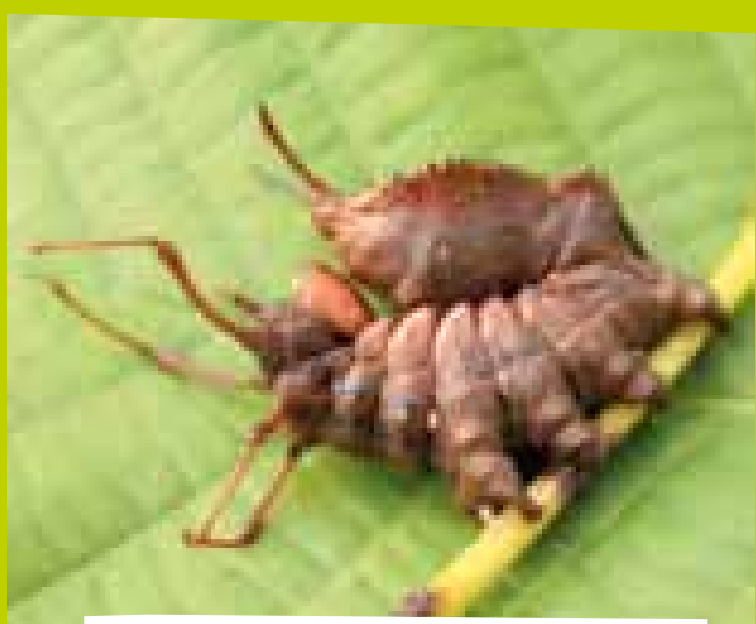
RAUPE DES BUCHEN-ZAHNSPINNERS IN SCHRECKSTELLUNG