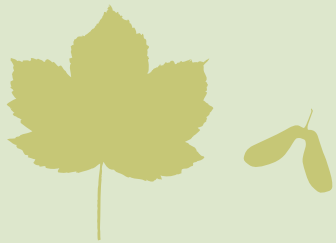
Bergahorn ( Acer pseudoplatanus )