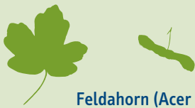
Feldahorn ( Acer campestre )