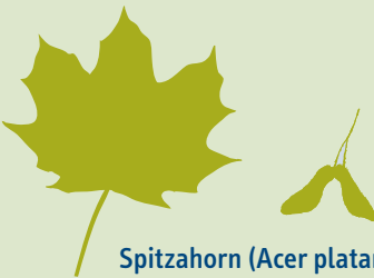
Spitzahorn ( Acer platanoides )